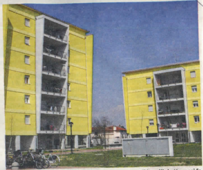
Le due palazzine Ater di via Brugnera consegnate agli inquilini otto mesi fa