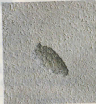
Un buco sul muro dello stabile